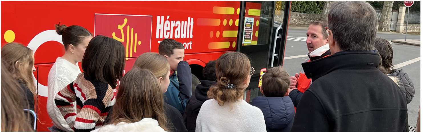
Opération de sensibilisation au collège Paul Dardé de Lodève le vendredi 24 janvier 2025.